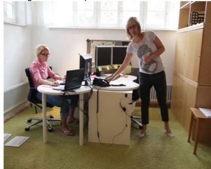
Sogar für einen kleinen Bistrotisch hatte es noch Platz